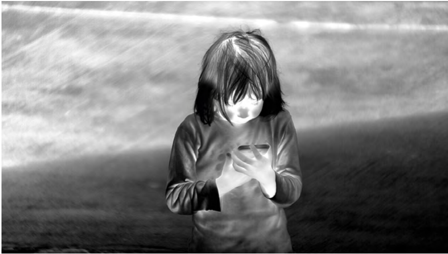
Abb. 01: Richard Mosse: Incoming , Standbild, 2014–2017. Drei-Kanal-HD-Videoinstallation mit 7.3 Surround Sound, 52 Minuten. Mit freundlicher Genehmigung des Künstlers, carlier | gebauer, Berlin, und Jack Shainman Gallery, New York.