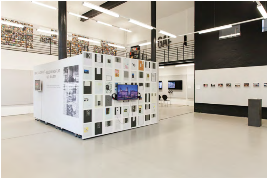
Abb. 02: Ausstellungsansicht Images in Conflict – Bilder im Konflikt , GAF – Galerie für Fotografie, Hannover, 18. Mai – 18. Juni 2017.

„Do we even need to be producing these images any more? Do we need to be looking at them? We have enough of an image archive within our heads to be able to conjure up a representation of any manner of pleasure or horror. Does the photographic image even have a role to play any more?“ 24