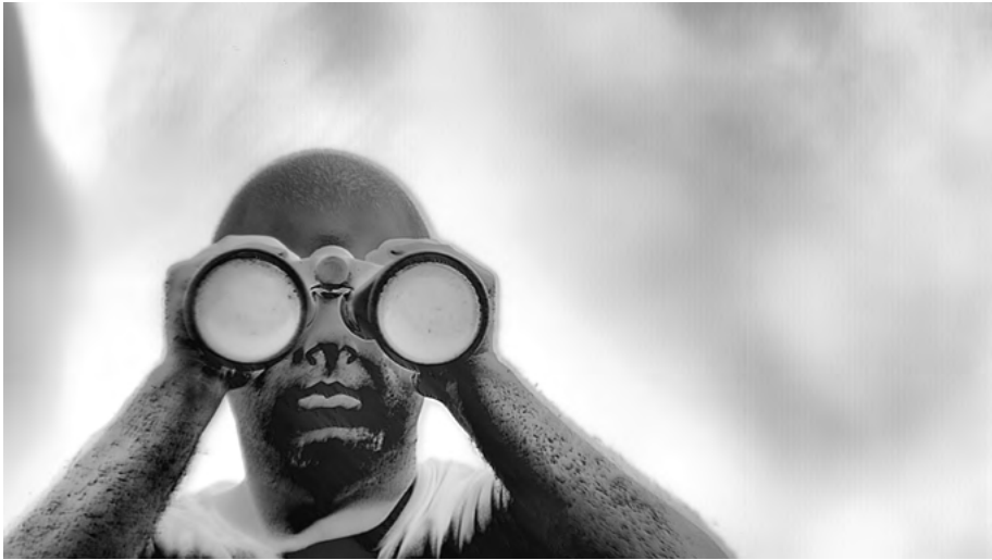
Fig. 03: Richard Mosse: Incoming , film still, 2014–2017. Three channel HD video installation with 7.3 surround sound, 52 minutes. Courtesy of the artist, carlier | gebauer, Berlin, and Jack Shainman Gallery, New York.